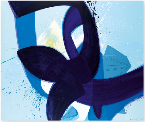
„Verve 3“, 160 x 190 cm, Acryl auf Leinwand, Aatifi 2018

Aatifi und seine abstrakt-skripturale Bildsprache